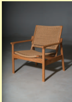
筑波大学芸術賞(卒業研究) Nien Chen Yuan《イージーチェア》