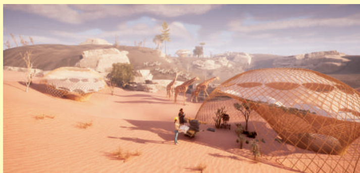
茗溪会賞(卒業研究) 長井 春雅くらら《生命の種》