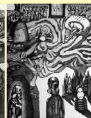
筑波大学芸術賞(修了研究) 王 敬昇《欄干会大壁画-1,2,3,4》