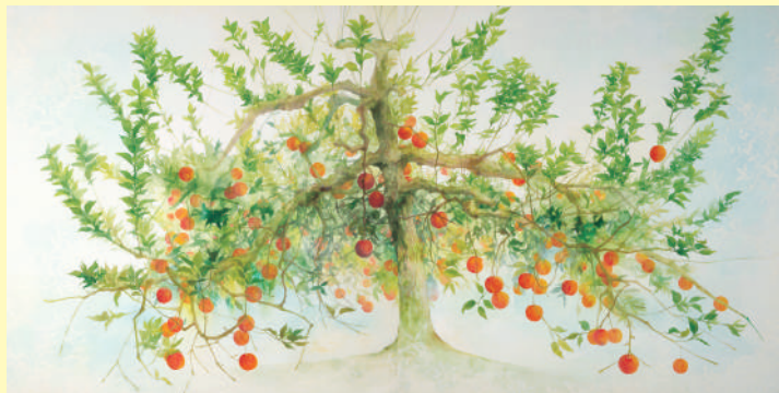
茗溪会賞(卒業研究) 山形 彩月《生彩》