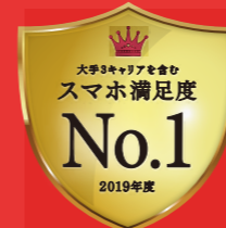
2019年度サービス産業生産性協議会 JCSI(日本版顧客満足度指数)調べ