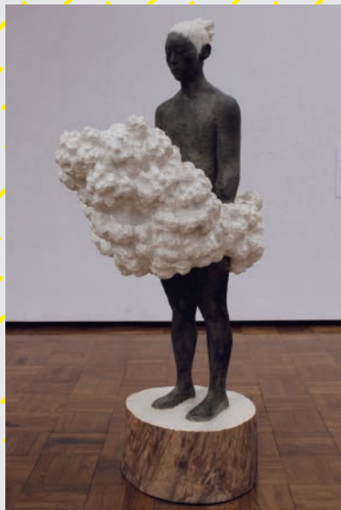
《見えない足元》二〇一五年

【問い合わせ】 関彰商事 総務部 ☎ 029-860-5151 (平日9:00-17:00) ✉ studio@sekisho.co.jp