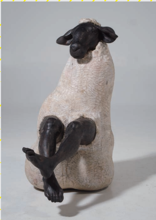
《浮上する情動、夢見る乙女》二〇一三年