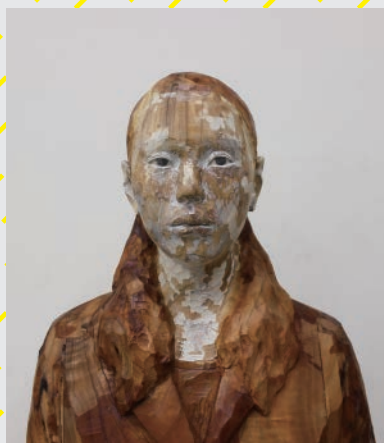
《ここではないどこか》二〇一六年