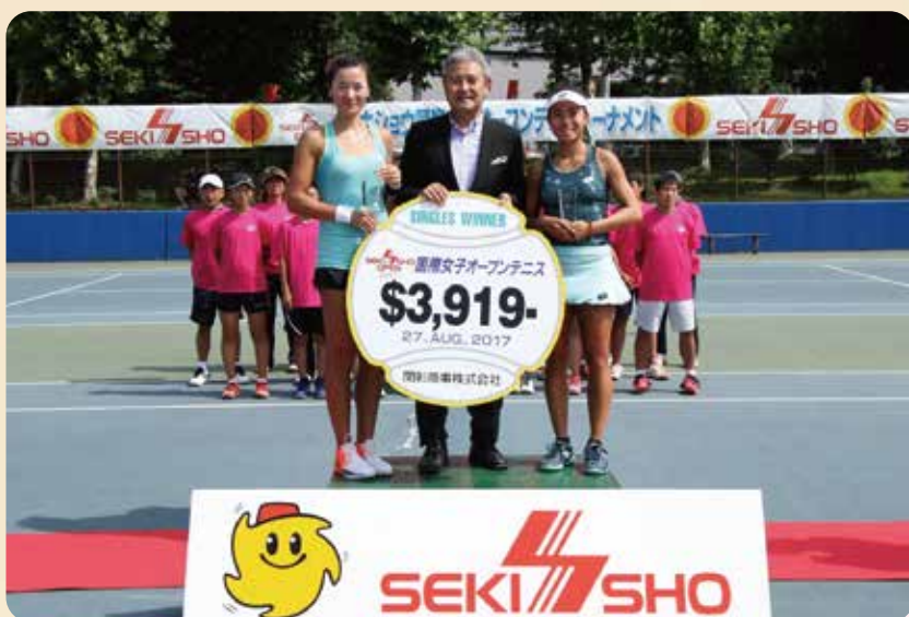
【8月27日～20日】31回目となる「セキショウ国際女子オープンテニストーナメント」を開催しました。本年は、12ヶ国の選手連による熱い戦いが繰り広げられ、約3,200名のお客様にご来場頂きました。