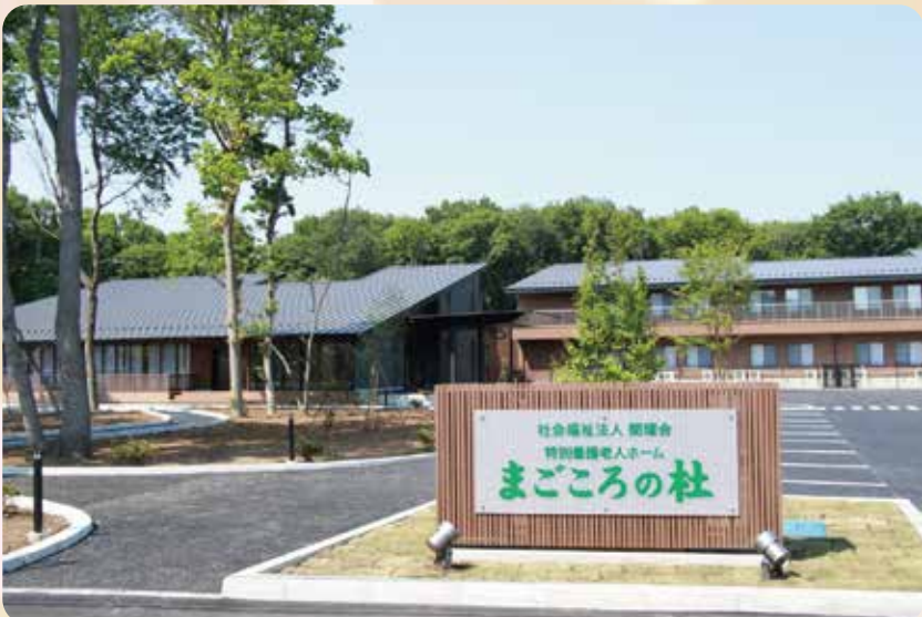
【6月27日】社会福祉法人関陽会は、特別養護老人ホーム「まごころの社」をオープンしました。「ずーっと笑顔で安心できる、安らぎの暮らし」をコンセプトに、周囲を自然林に囲まれた豊かな自然環境の中で、真心を込めてサービスをご提供します。