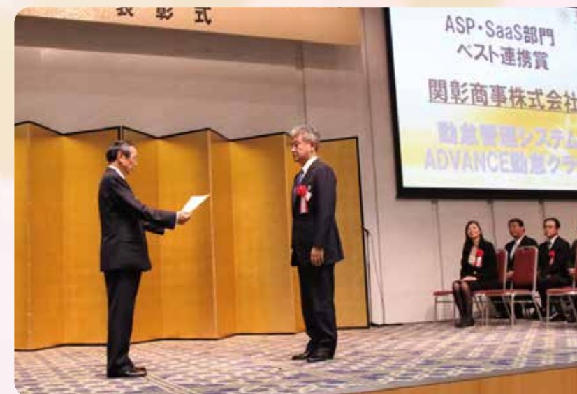
【11月7日】弊社が独自に開発した勤怠管理システム「ADVANCE 勤怠クラウド」が、NPO 法人 ASPIC 様主催の『第11回 ASPIC IoT・クラウドアワード2017』において「ASP・SaaS部門 ベスト連携賞」を受賞しました。