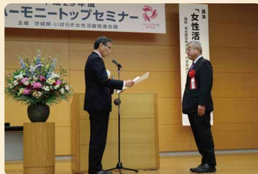
【11月17日】茨城県が実施する「茨城県女性が輝く優良企業認定制度」において最高位である「3つ星」の認定を受けました。「女性の積極採用」や「営業職・技術職への職域拡大」などの点を評価して頂きました。