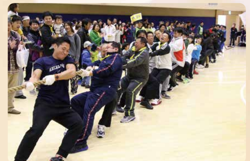
【11月23日】筑波大学体育センター様と連携し、「セキショウグループ全社運動会」を開催しました。スポーツを通じた社員の健康促進と交流を目的に約800名の社員が参加し、様々な部門の社員が一丸となり、チーム力の大切さを学ぶ良い機会となりました。