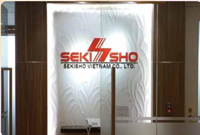
【8月14日】ベトナム・ハノイに弊社現地法人「SEKISHO VIETNAM COMPANY LIMITED」を設立しました。現在、日本人社員2名、ベトナム人社員5名が人材サービス・システム開発の事業に取り組んでおります。