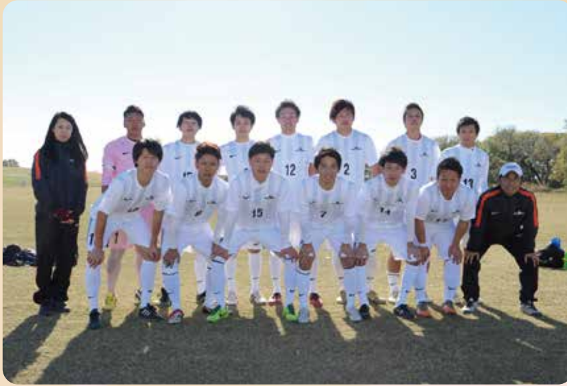
【4月1日】弊社サッカー部「セキショウフットボールクラブ」が開始しました。今年、茨城県サッカー協会社会人連盟3部リーグに参加し、見事リーグ優勝。来年は2部リーグへ参戦し、1部リーグ昇格を目指して活動します。