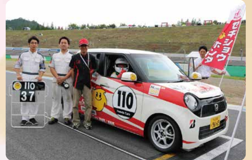
【8月19日】弊社グループのセキショウホンダ株式会社は、ホンダの軽自動車 N-ONE によるワンメイクレース「N-ONE OWNER'S CUP」に参戦しました。レースで培った技術と経験を通じて、より高品質なサービスをお客様に提供して参ります。