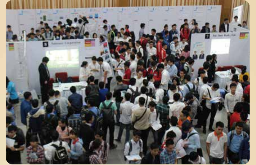
第2回（5月20）、第3回（11月4日）「SEKISHO JOB FAIR」を開催しました。日系企業に就職を希望するベトナム人大学生を対象とした合同企業説明会および面接会には、両回合計865名の皆様にご参加頂きました。