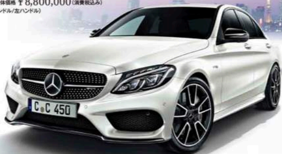
ボディカラー=ダイヤモンドホワイト