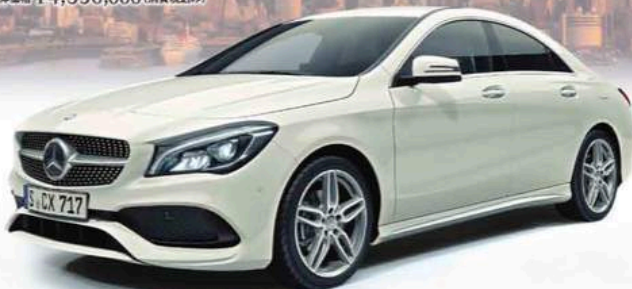
ボディカラー=カルサイトホワイト