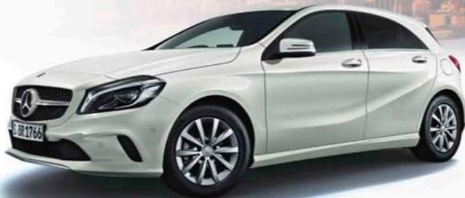
ボディカラー=カルサイトホワイト