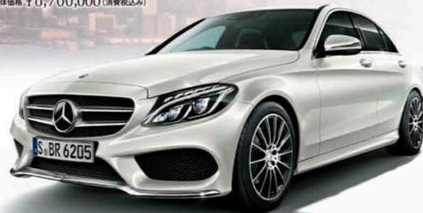
ボディカラー=ダイヤモンドホワイト