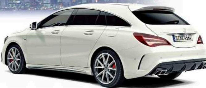
ボディカラー=カルサイトホワイト