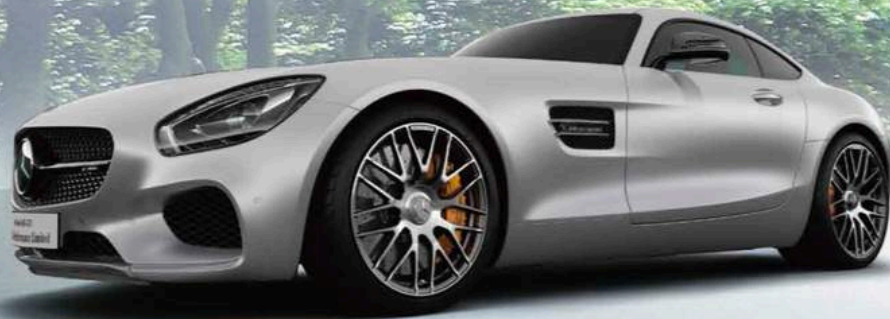
Photo / Mercedes-AMG GT S Carbon Performance Limited (ボディカラー:イリジウムシルバーマグノ)